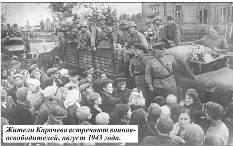
Жители Карачева встречают воинов-освободителей, август 1943 года.