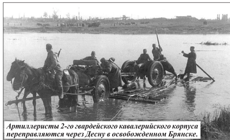
Артиллеристы 2-го гвардейского кавалерийского корпуса переправляются через Десну в освобожденном Брянске.