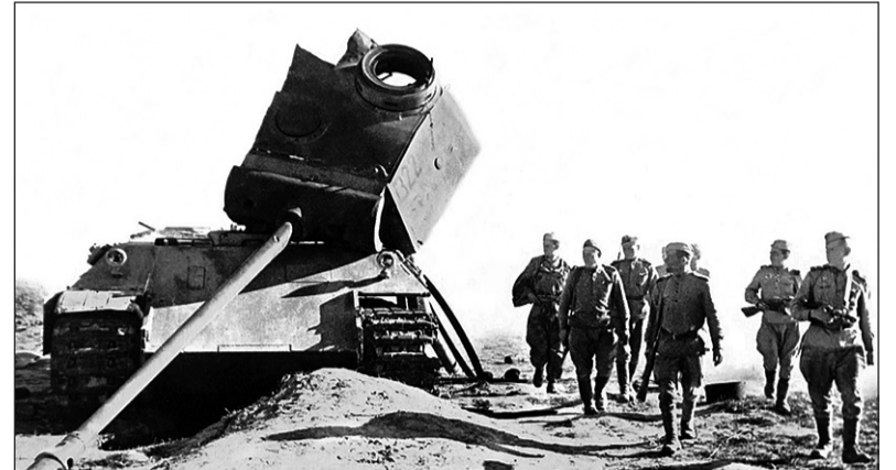
Красноармейцы идут мимо подбитого танка «Пантера» Pz.Kpfw. V Ausf. D (№ 322) 51-го танкового батальона панцер-гренадерской дивизии «Великая Германия» (Panzergranadier-Division «Großdeutschland»). Район города Карачева, август 1943 года.

7 сентября, когда внимание противника было привлечено к