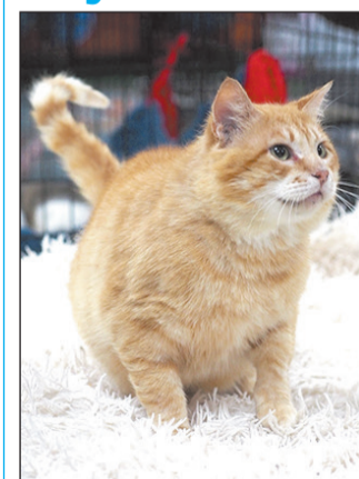
Кот Бизон приехал из Донбасса. Взрослый (12 лет) и умный. Привит и кастрирован.

Наша редакция и приют «Второй шанс» продолжают специальную рубрику. Вдруг среди опубликованных четвероногих обитателей приюта вы найдете свое счастье.